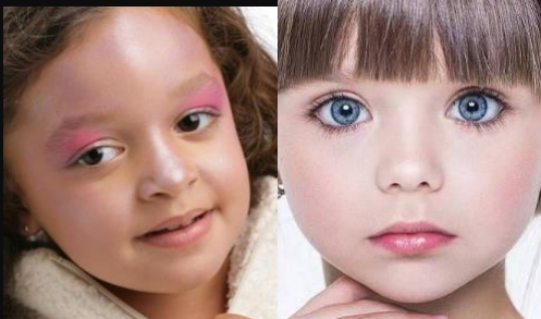
Neutre ou léger pour les enfants